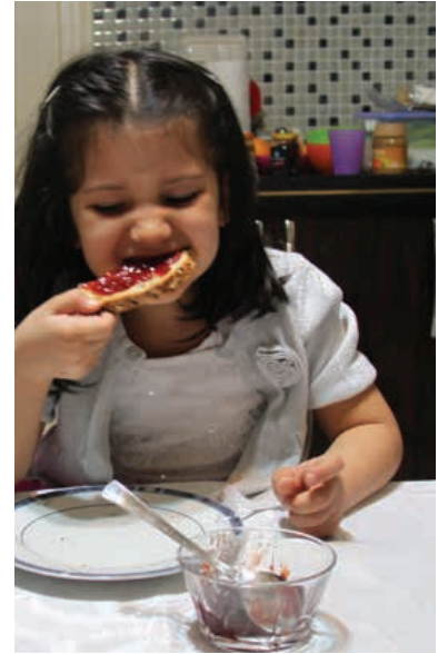
ليلي تحب مربى الفراولة

تحدث مع طفلك عما يحب وعما لا يحب، وساعده على إدراك مفهوم أنه عندما يحب شيء فرمها شخص آخر لا يجبه. فكلما كان الطفل واضح كلما أدرك أن الأشخاص يختلفون في آرائهم.