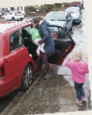
اليوم سوف تذهب العائلة لزيارة مزرعة حقيقية