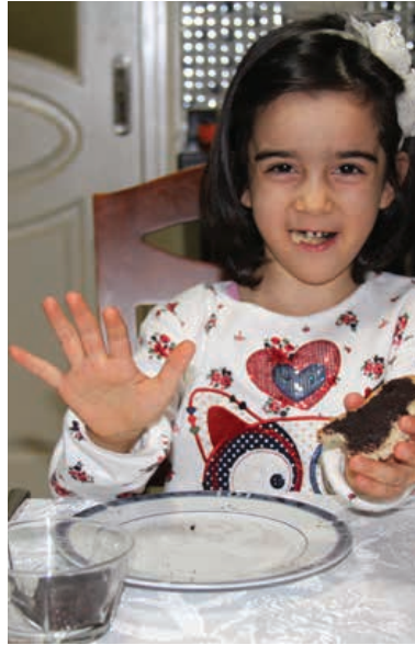
مريم لا تحب فرد الزيتون